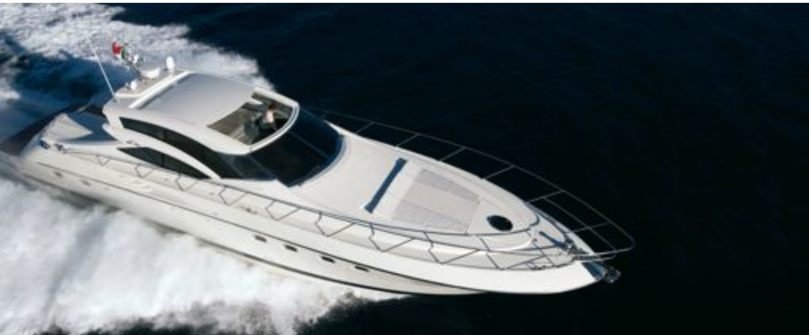
Sarnico 60 / 60GT

Non segue la tendenza, la crea, imponendo il suo stile, così funzionale alla sua abitabilità. Stabile, sicura, veloce, grazie alla tecnologia da cui è nata.